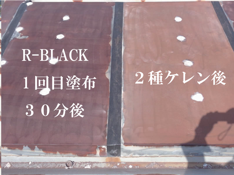
丁寧な2種ケレン後の屋根部の状況