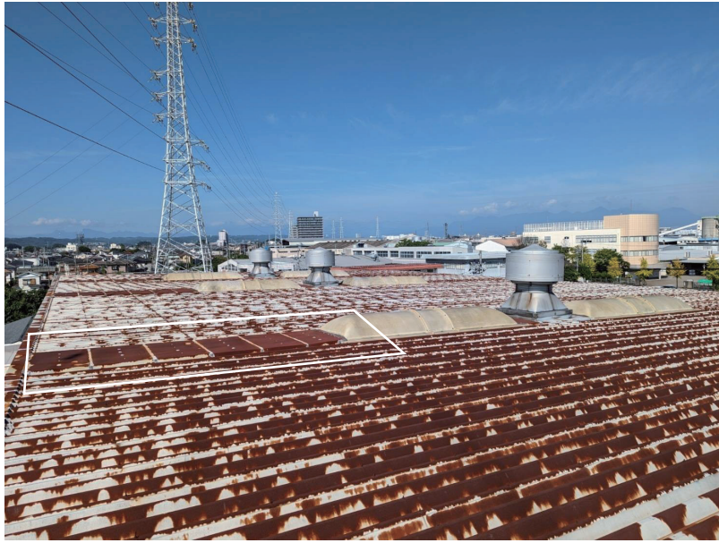
屋上屋根部赤錆の改修 1次改修：屋根白線部