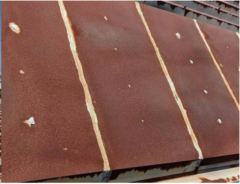
白線屋根部の赤錆の状態