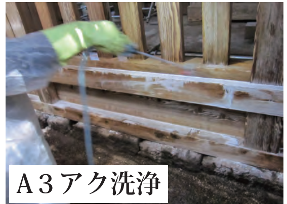
A 3 アクリル洗浄

3：水洗い後木部シミ抜き洗浄剤 S 4 を塗布・・・水洗い・・・乾燥で白木美が再現・・・赤味減少