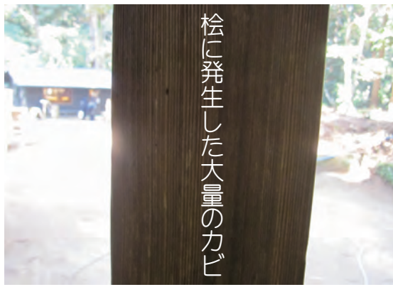
桧に発生した大量のカビ