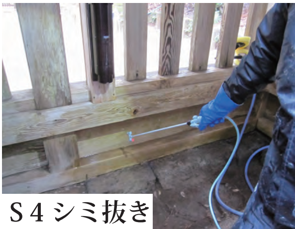
S 4 シミ抜き