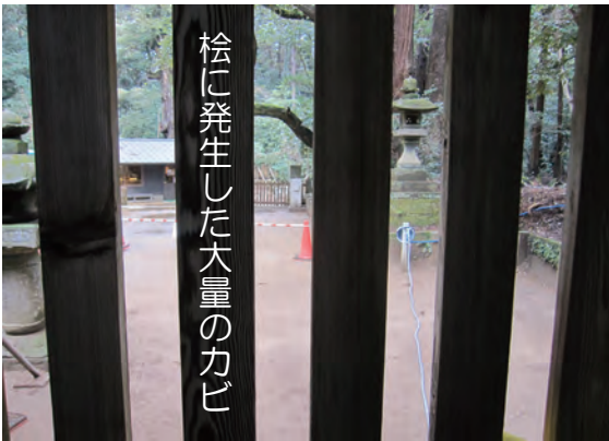
桧に発生した大量のカビ