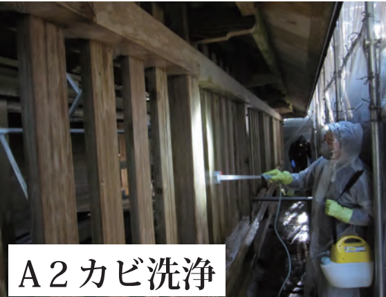
A 2 カビ洗浄