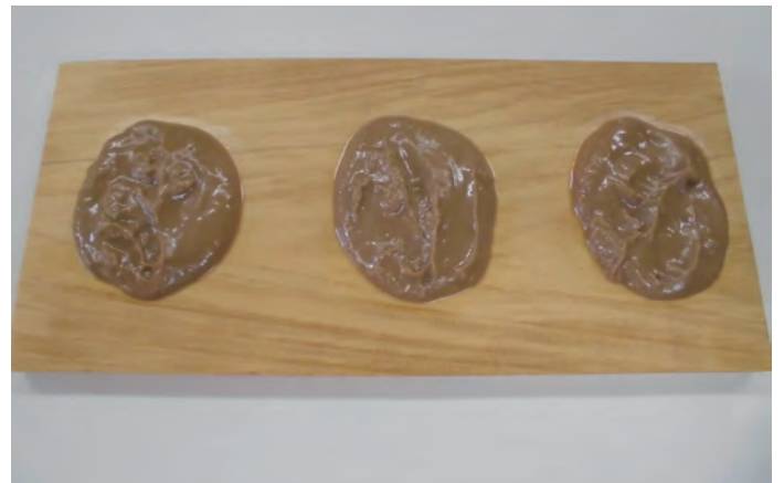
貼り付けた時間毎の油吸着を確認しました