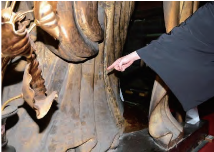
24時間、サラダ油を木部に浸み込ませる