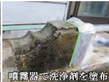
噴霧器で洗浄剤を塗布