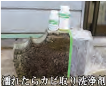
濡れたらカビ取り洗浄剤