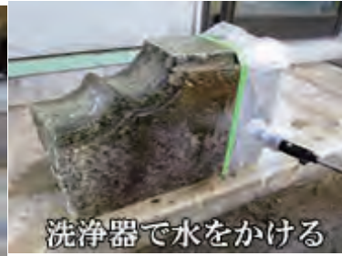
洗浄器で水をかける