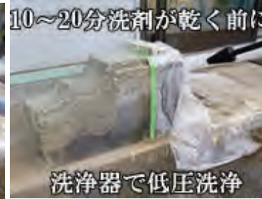
洗浄器で低圧洗浄