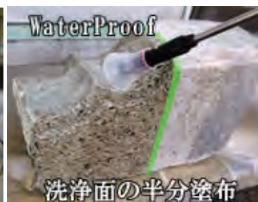
WaterProof 洗浄面の半分塗布