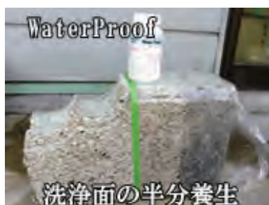
WaterProof 洗浄面の半分養生