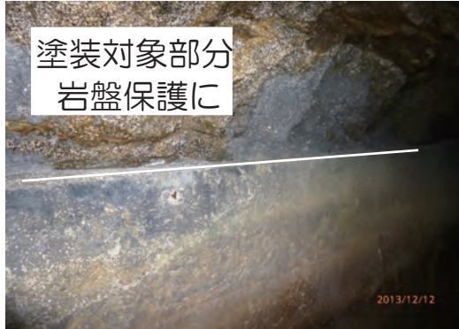
上部御影石岩盤に塗布