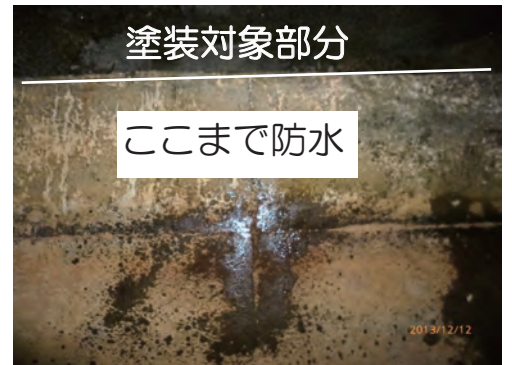
水性防水剤 Water Proofを塗布 面は防水状態で水滴で水滴が垂れます