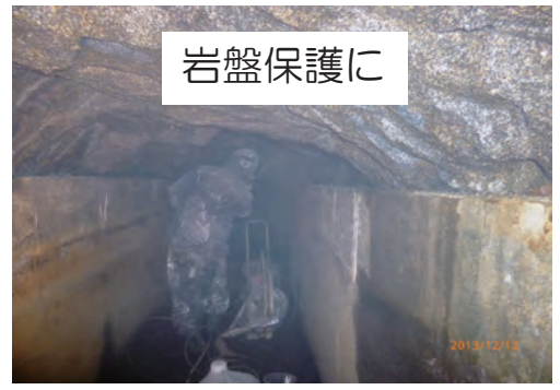
御影石岩盤に水性防水剤Water Proofを塗布