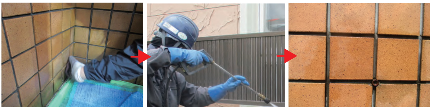
水洗い後の水分を含んだせつ器質タイル