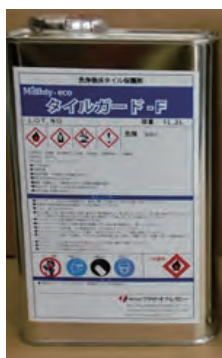
洗浄痕凹凸を平滑補修