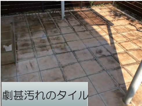
劇甚汚れのタイル