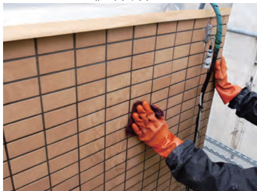
タイル洗浄剤 S 3 で