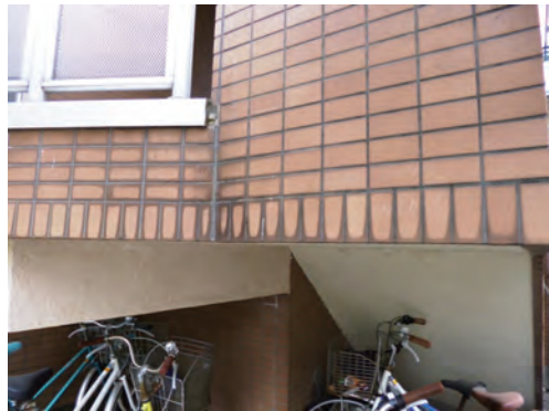
世田谷区マンション改修